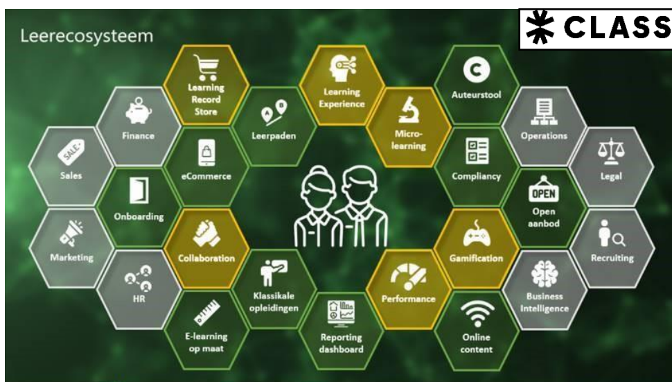
Figuur 1: bouwstenen van een leerecosysteem

Class is een Software as a Service (SAAS) oplossing. Het leerplatform is modulair opgebouwd volgens de modernste ICT-standaarden op basis van Microsoft .NET technologie. Je kunt het platform flexibel inrichten en aanpassen aan de huisstijl van jouw organisatie. Wij zijn ervan overtuigd dat er niet één systeem is dat alles kan en maken gebruik van de kracht en expertise van bestaande en nieuwe systemen, tools of content binnen jouw eigen leerecosysteem.